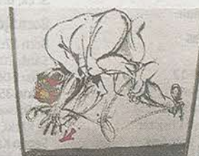
En energisk kapitalism.