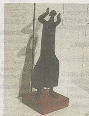
Skulpturen Kvinna av Mats Lodén.

Grupputställningen bjuder på många häftiga och gränslösa kontraster. Saker som påminner om varandra och andra ting som visar på olikheterna. "Vägskäl" kan se tillbaka på en lång rad olika teman och utländska inslag. "Vägskäl" har omfamnat konstnärer