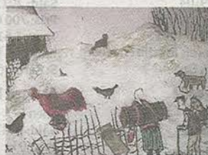
Här finns även naivistiska uttryck.